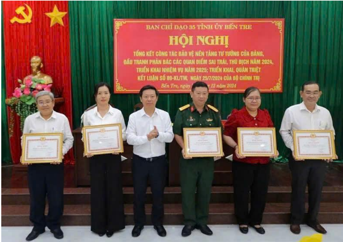
Ảnh: Trao bằng khen cho các tập thể, cá nhân tại hội nghị.

t toàn quân, với những thời cơ, thuận lợi mới, dưới sự lãnh đạo của Đảng, chúng ta hội tụ đủ những điều kiện cần thiết... để đưa đất nước bước vào kỷ nguyên mới, kỷ nguyên vươn mình của dân tộc Việt Nam”. Với vai trò tiên phong, công tác tuyên giáo cần phải có những đột phá về tư duy, nhận thức, quyết liệt trong hành động, để đạt được kết quả tốt nhất trên mặt trận tư tưởng, văn hoá của Đảng.