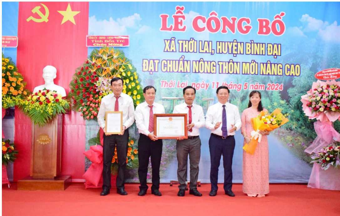
Lãnh đạo tỉnh trao bằng công nhận xã Thời Lại, huyện Bình Đại đạt chuẩn nông thôn mới nâng cao.

Kết quả xây dựng nông thôn mới (NTM) được đẩy mạnh, vượt chỉ tiêu Nghị quyết. Đến nay, toàn tỉnh có 113/132 xã đạt chuẩn NTM (số liệu đã được điều chỉnh sau sắp xếp đơn vị hành chính cấp xã trên địa bàn tỉnh), đạt 85,6%/80%, vượt 5,6% so với chỉ tiêu Nghị quyết Đại hội XI Đảng bộ tỉnh trước 1 năm (trong đó, có 46/113 xã đạt chuẩn NTM nâng cao, đạt 40,7%/40%, chỉ tiêu Nghị quyết; 19 xã đạt chuẩn NTM kiểu mẫu, vượt so với chỉ tiêu Nghị quyết là mỗi huyện có ít nhất 1 xã NTM kiểu mẫu). Huyện Mỏ Cày Nam được Thủ tướng Chính phủ quyết định công nhận đạt chuẩn huyện NTM năm 2023. Hiện UBND tỉnh đang chỉ đạo Văn phòng Điều phối Chương trình xây dựng NTM tỉnh hướng dẫn thực hiện và hoàn thiện hồ sơ đề nghị công nhận huyện Chợ Lách đạt tiêu chí huyện NTM nâng cao; thành phố Bến Tre hoàn thành nhiệm vụ xây dựng NTM. Các huyện Châu Thành, Thạnh Phú, Mỏ Cày Bắc, Bình Đại cơ bản đạt các tiêu chí huyện NTM.