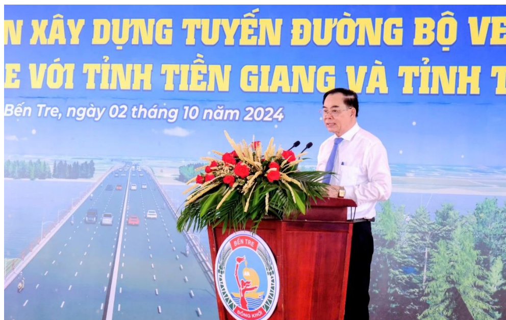
Ảnh: Chủ tịch UBND tỉnh Trần Ngọc Tam phát biểu tại lễ khởi công dự án cầu Ba Lai 8 và khởi động dự án đường bộ ven biển kết nối 3 tỉnh Tiền Giang - Bến Tre - Trà Vinh.