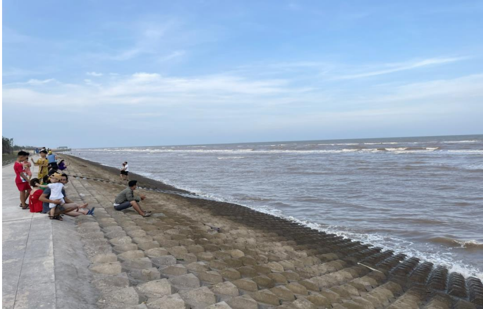
Biển xã Thạnh Hải (Thạnh Phú).

ngang, ven biển và hải đảo giai đoạn 2021 - 2025 thuộc các tỉnh Thanh Hóa, Quảng Trị, Bến Tre, Kiên Giang thoát khỏi tình trạng đặc biệt khó khăn trong năm 2024 và đưa các xã này ra khỏi danh sách xã đặc biệt khó khăn vùng bãi ngang, ven biển và hải đảo giai đoạn 2021 - 2025.