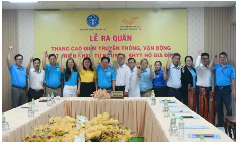
Lễ ra Quân Tháng cao điểm truyền thông, vận động phát triển BHXH tự nguyện, BHYT hộ gia đình năm 2024.