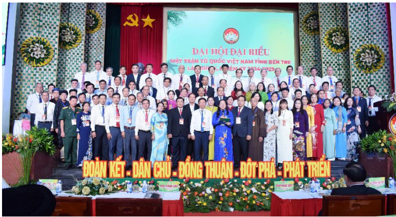
Đại hội đại biểu MTTQ Việt Nam tỉnh Bến Tre lần thứ X, nhiệm kỳ 2024 - 2029 thành công tốt đẹp.

Tỉnh Bến Tre đã tổ chức thành công Đại hội MTTQ các cấp nhiệm kỳ 2024 - 2029, đạt được nhiều kết quả quan trọng trong công tác xây dựng khối đại đoàn kết toàn dân tộc, củng cố hệ thống tổ chức của Mặt trận và đẩy mạnh các hoạt động xã hội. Đại hội Đại biểu MTTQ Việt Nam các cấp nhiệm kỳ 2024 - 2029 diễn ra xã, phường, thị trấn đến tinh thu hút sự tham gia của đông đảo đại biểu đại diện cho các tầng lớp nhân dân và các tổ chức chính trị - xã hội.