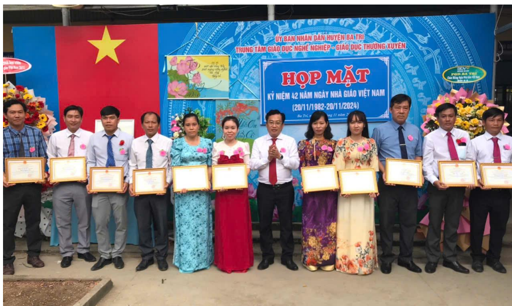
Ảnh: Bí thư Huyện ủy Ba Tri Võ Văn Phú dự họp mặt kỷ niệm 42 năm Ngày Nhà giáo Việt Nam.

Năm 2024, Đảng bộ và nhân dân huyện Ba Tri đã thực hiện nghị quyết đạt được nhiều kết quả quan trọng. Kinh tế tiếp tục tăng trưởng; văn hóa - xã hội có nhiều chuyển biến tích cực; an sinh xã hội được thực hiện tốt, đời sống người dân ổn định; quốc phòng - an ninh được giữ vững; hệ thống chính trị tiếp tục được củng cố và kiên toàn. Trong 21 chỉ tiêu năm 2024, đến nay có 17/21 chỉ tiêu đạt và vượt, 4/21 chỉ tiêu không đạt (trong đó đạt trên 80 - 90%: 2/21 chỉ tiêu, dưới 80 % có 2/21 chỉ tiêu).