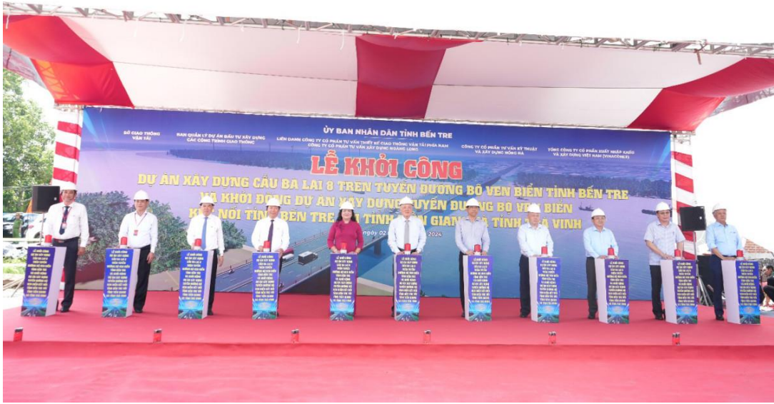
Thực hiện nghi thức Lễ khởi công cầu Ba Lai 8.

Trong hai ngày 2 và 3-10-2024, UBND tỉnh Bến Tre tổ chức chuỗi sự kiện xúc tiến đầu tư, với chủ đề “Tầm nhìn hướng Đông và tiềm năng phát triển bền vững”; đồng chí Nguyễn Hòa Bình - Ủy viên Bộ Chính trị, Phó Thủ tướng Thường trực Chính phủ dự chủ trì và phát biểu. Các hoạt động chính của chuỗi sự kiện gồm: (1) Khởi công cầu Ba Lai 8, công trình có ý nghĩa khởi động tuyến giao thông động lực ven biển trên địa bàn tỉnh Bến Tre; (2) Hội thảo năng lượng mới và năng lượng tái tạo - tiềm năng và nguồn lực đầu tư tỉnh, giới thiệu những tiềm năng, thế mạnh của tỉnh; (3) Hội nghị xúc tiến đầu tư tỉnh Bến Tre năm 2024 giới thiệu khoảng 32 dự án trên nhiều lĩnh vực với tổng vốn đầu tư dự kiến đăng ký trên 300 nghìn tỷ đồng; trong đó, ưu tiên các lĩnh vực kinh tế biển và phát triển hướng Đông. Tại hội nghị, UBND tỉnh Bến Tre đã trao 6 quyết định chủ trương đầu tư cho các doanh nghiệp đầu tư 6 dự án trên địa bàn, với tổng mức đầu tư hơn 7.985 tỷ đồng.