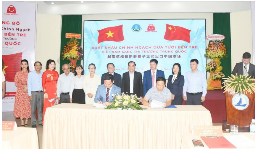
Lễ ký kết hợp tác giữa doanh nghiệp Việt Nam và doanh nghiệp Trung Quốc.

- Năm 2024, Bến Tre đã đạt được một cột mốc quan trọng trong phát triển kinh tế khi lần đầu tiên kim ngạch xuất nhập khẩu đạt 2,2 tỷ USD, trong đó xuất khẩu đạt 1,75 tỷ USD, tăng 20,27% so với cùng kỳ năm trước. Trong tổng kim ngạch xuất khẩu, mặt hàng dừa đóng vai trò nổi bật, với giá trị xuất khẩu đạt gần 0,52 tỷ USD; kết quả này không chỉ thể hiện đóng góp quan trọng của ngành dừa mà còn phản ánh sự phát triển vượt bậc của lĩnh vực xuất khẩu tỉnh nhà, là kết quả của sự nỗ lực không ngừng của các doanh nghiệp, cũng như sự quan tâm, hỗ trợ và chỉ đạo sát sao của các cấp ủy Đảng và chính quyền. Việc mở rộng thị trường và gia tăng giá trị xuất khẩu là những yếu tố quan trọng giúp tỉnh đạt được bước tiến lớn trong thời gian qua. Đây là tín hiệu tích cực, mở ra nhiều cơ hội mới cho nền kinh tế Bến Tre, khẳng định vị thế của tỉnh trong ngành xuất khẩu nông sản của Việt Nam..