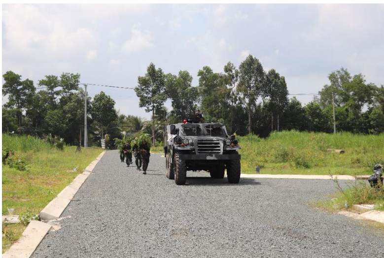
Ảnh: Ảnh diễn tập khu vực phòng thủ năm 2024.

Cụ thể trong năm 2024 đã tổ chức 12 lớp tập huấn cho các đối tượng. Huấn luyện cán bộ Khung B cho 1.173 đồng chí; huấn luyện dân quân năm thứ nhất 3.016 đồng chí; huấn luyện Đại đội Pháo 85mm 30 đồng chí. Huấn luyện lực lượng thường trực đạt 100%; tập huấn, huấn luyện dân quân tự vệ đạt 95,18%; huấn luyện dự bị động viên được đạt 99,91%. Kiểm tra chiến sỹ mới 11/11 nội dung, kết quả (06 nội dung đạt giỏi; 05 nội dung đạt khá). Tham mưu Ban Chỉ đạo diễn tập tỉnh tổ chức diễn tập khu vực phòng thủ huyện Giồng Trôm, thành phố Bến Tre, huyện Mỏ Cày Bắc; chỉ đạo huyện, thành phố tổ chức diễn tập cấp xã các hình thức theo quy định, đến nay đã diễn tập 42/42 đơn vị, đạt 100%. Kiểm tra, theo dõi ban chỉ huy quân sự huyện, thành phố, Trung đoàn BB895 tổ chức diễn tập Chỉ huy - Tham mưu (Chỉ huy - Cơ quan) 1 bên 1 cấp trên bản đồ và ngoài thực địa.