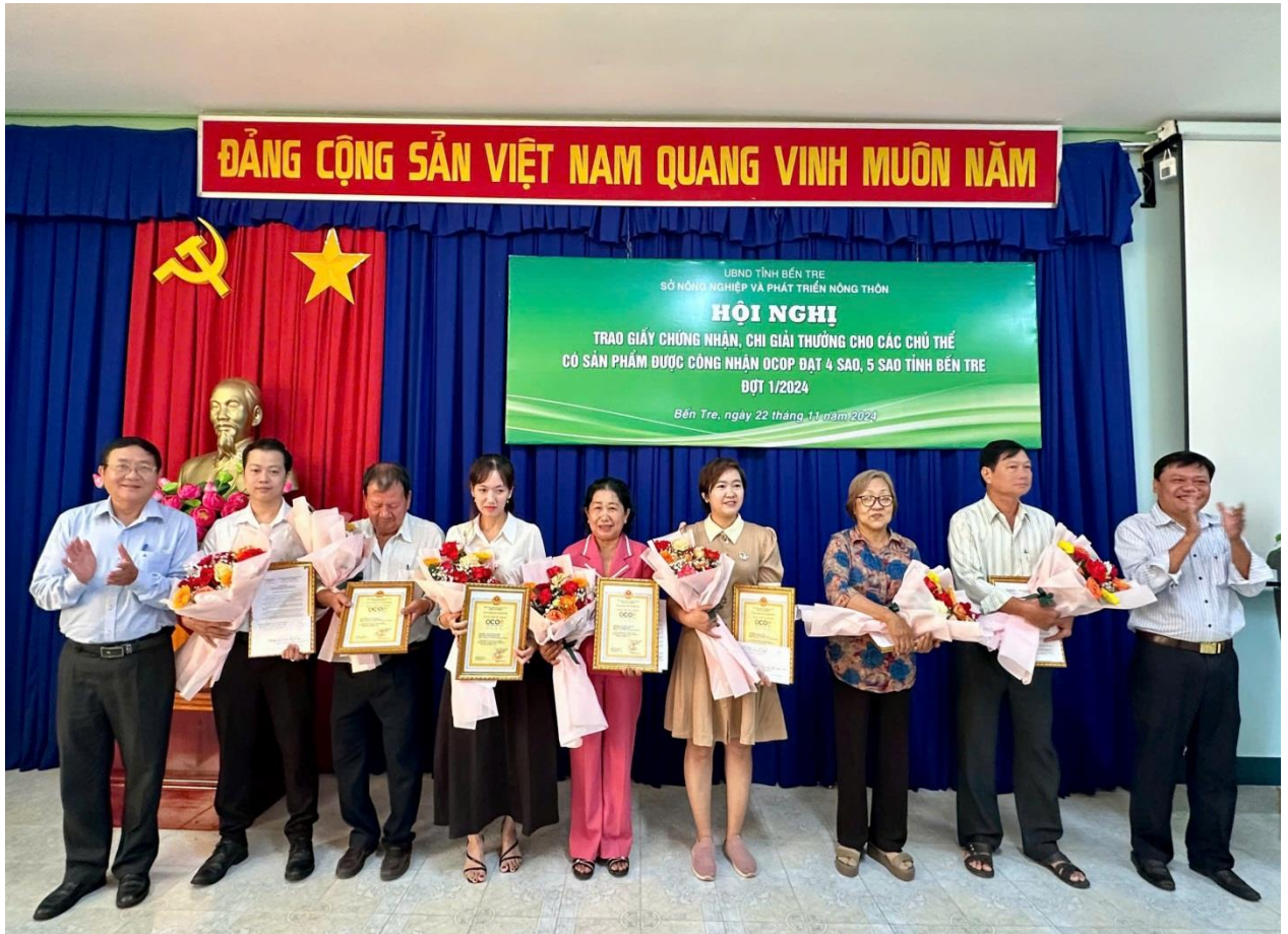
Ảnh: Lãnh đạo Sở Nông nghiệp và Phát triển nông thôn trao chứng nhận, giải thưởng cho chủ thể OCOP 4 sao, 5 sao.

ứng tích cực của người dân trong tỉnh. Các sản phẩm OCOP của tỉnh dần được hoàn thiện theo hướng phát huy các giá trị truyền thống, nâng cao chất lượng mẫu mã, bao bì, đảm bảo an toàn thực phẩm và truy xuất nguồn gốc gắn với cải tiến dây chuyền sản xuất thân thiện với môi trường,... góp phần đưa sản phẩm nông nghiệp của tỉnh vào các thị trường tiềm năng, tăng tính cạnh tranh với các sản phẩm cùng loại.