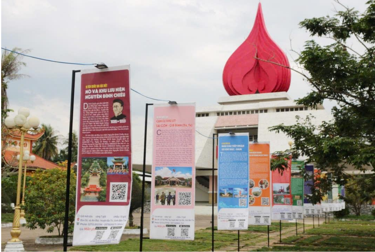
Các khung treo ảnh có mã QR, giới thiệu di sản văn hóa vật thể và phi vật thể của Bến Tre tại Di tích quốc gia đặc biệt Đồng Khởi.

Ngày 27-11-2024, Phó thủ tướng Chính phủ Lê Thành Long ký Quyết định số 1478/QĐ-TTg lấy ngày 17 tháng 01 hằng năm là “Ngày truyền thống tỉnh Bến Tre”.