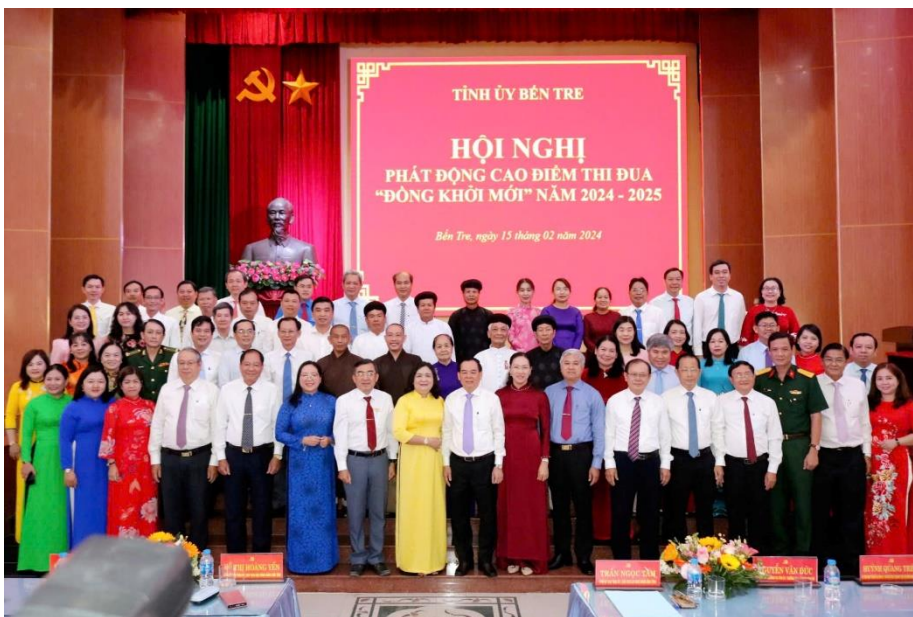
Ảnh: Các đồng chí lãnh đạo tỉnh chụp ảnh tại hội nghị phát động cao điểm thi đua “Đồng Khởi mới” năm 2024 - 2025.

27/11/2024 vừa qua, Thủ tướng Chính phủ đã ký Quyết định số 1478/QĐ-TTg công nhận ngày 17 tháng 01 hàng năm, là ngày truyền thống của tỉnh Bến Tre. Đây là niềm tự hào, vinh dự lớn, là động lực tinh thần mạnh mẽ để Đảng bộ và Nhân dân Bến Tre tiếp tục phấn đấu tạo ra những kết quả quan trọng trong công tác xây dựng Đảng, phát triển kinh tế - xã hội, hiện thực hoá khát vọng vươn lên. Có thể nói “Đồng Khởi mới” là sự kế thừa có bước phát triển về tư duy, tính chất và nội dung từ Đồng khởi 1960, để tiếp tục tạo nên những giá trị mới trong kỷ nguyên mới, kỷ nguyên vươn mình của dân tộc. Dấu ấn, sự kế thừa này được thể hiện rõ qua chủ trương lãnh đạo, chỉ đạo của Tỉnh uỷ, Ban Thường vụ Tỉnh uỷ, kết quả thực hiện phong trào thi đua “Đồng Khởi mới” và định hướng phát động thi đua ở giai đoạn tiếp theo.