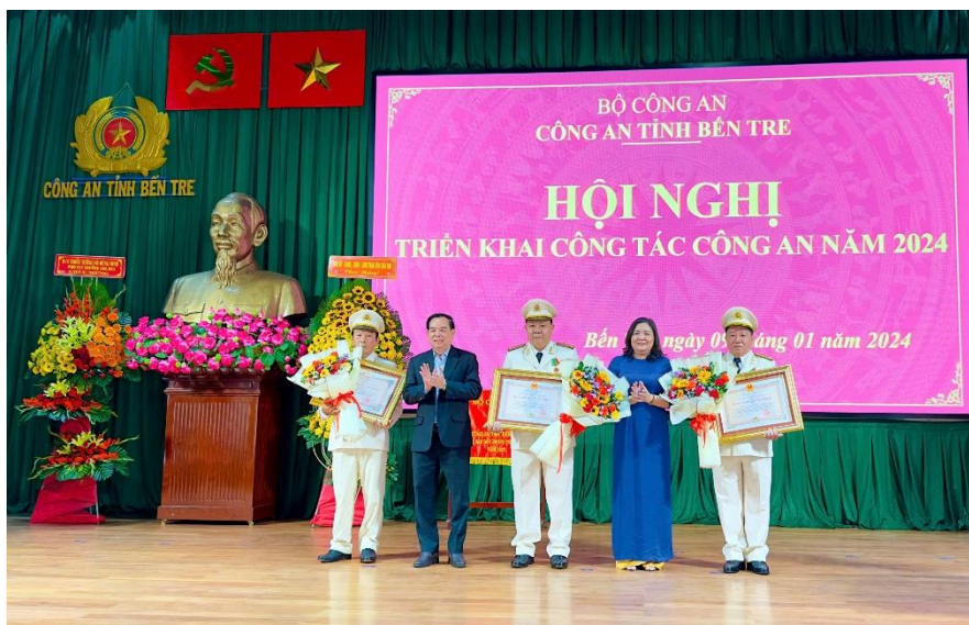
Ảnh: Lãnh đạo Tỉnh ủy, UBND tỉnh trao Huân chương bảo vệ Tổ quốc hạng ba cho các cá nhân.

Cùng với các hoạt động của lực lượng CAND cả nước, ngày 19/8/2024, Công an tỉnh đã tổ chức phát động phong trào thi đua đặc biệt chào mừng kỷ niệm 80 năm Ngày truyền thống CAND (19/8/1945 - 19/8/2025) và 20 năm Ngày hội toàn dân bảo vệ an ninh Tổ quốc (19/8/2005 - 19/8/2025). Phong trào thi đua lấy chủ đề “Xây dựng lực lượng Công an Bến Tre thật sự trong sạch, vững mạnh, chính quy, tinh nhuệ, hiện đại”; với phương châm hành động “Phát huy truyền thống, rèn cán luyện công, vì nước quên thân, vì dân phục vụ”. Phong trào thi đua được tổ chức trong thời gian từ ngày 19/8/2024 đến ngày 19/8/2025, chia thành 3 đợt. Đợt 1, từ ngày 19/8/2024 đến ngày 03/02/2025: Thi đua lập thành tích chào mừng kỷ niệm 95 năm Ngày thành lập Đảng Cộng sản Việt Nam. Đợt 2, từ ngày 04/02/2025 đến ngày 19/5/2025: Thi đua lập thành tích chào mừng kỷ niệm 135 năm Ngày sinh Chủ tịch Hồ Chí Minh và 50 năm Ngày giải phóng miền Nam, thống nhất đất nước. Đợt 3, từ ngày 20/5/2025 đến ngày 19/8/2025: Thi đua lập thành tích chào mừng kỷ niệm 80 năm Ngày truyền thống CAND và 20 năm Ngày hội toàn dân bảo vệ an ninh Tổ quốc. Phong trào thi đua đặc biệt đề ra sát với nhiệm vụ chính trị của ngành, gắn với từng lĩnh vực công tác chuyên môn, cụ thể như sau: