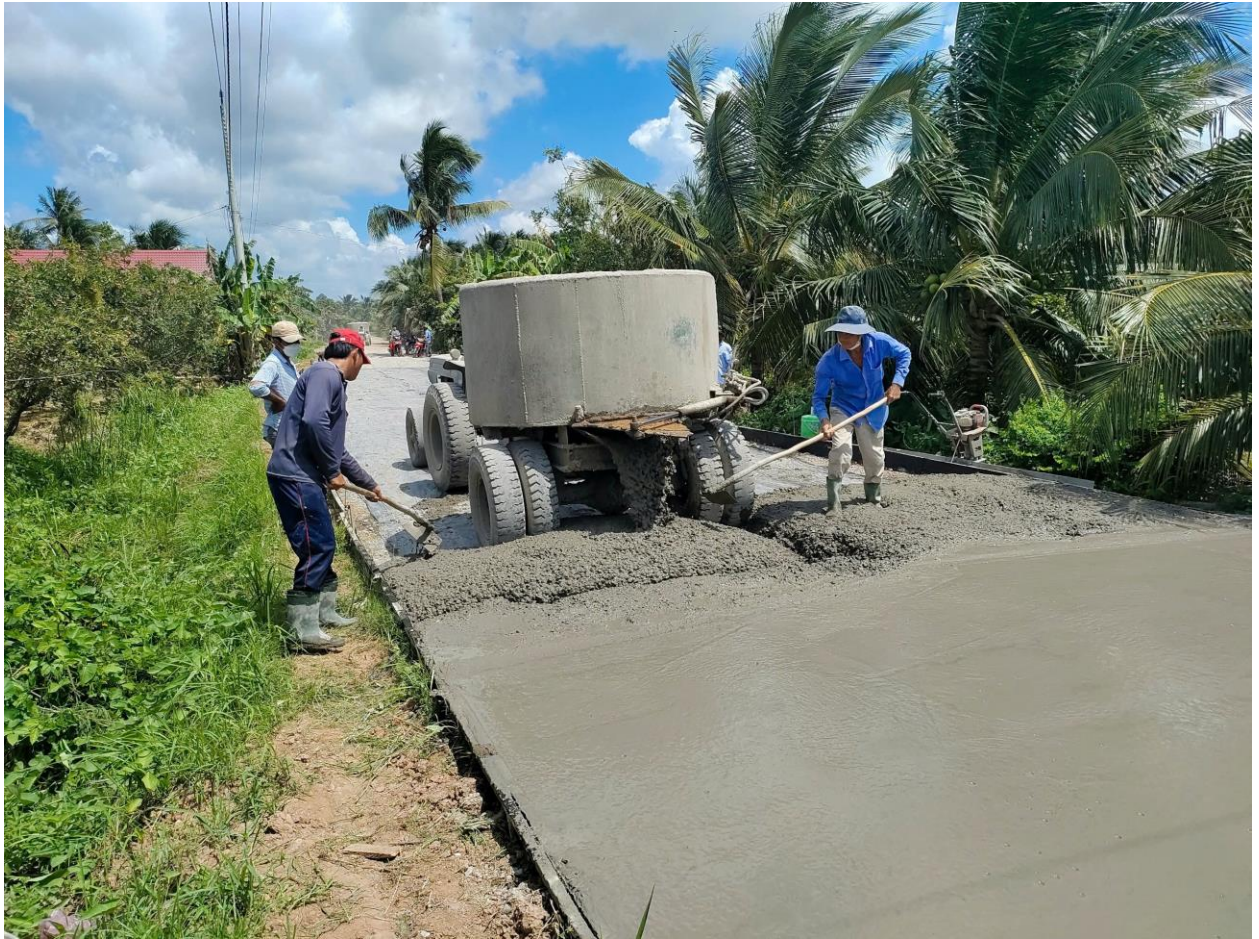
Ảnh: Xây dựng các công trình giao thông nông thôn.

Giai đoạn 2021 - 2025, tỉnh Bến Tre đặt ra mục tiêu là xây dựng 05 huyện đạt chuẩn nông thôn mới (Châu Thành, Mỏ Cày Bắc, Mỏ Cày Nam, Thạnh Phú và Bình Đại); ít nhất 80% xã đạt chuẩn nông thôn mới (tương đương 111 xã), 40% xã đạt chuẩn nông thôn mới nâng cao (tương đương 44 xã), các xã còn lại đạt 15 tiêu chí trở lên. Với nhu cầu vốn đầu tư từ ngân sách Trung ương và ngân sách tỉnh khoảng hơn 2.500 tỷ đồng, tuy nhiên giai đoạn này tỉnh Bến Tre chỉ được Trung ương giao 873,1 tỷ đồng (bằng 85,5% kế hoạch vốn Trung ương giao giai đoạn 2016 - 2020 để thực hiện Chương trình). Do vậy, nhiều công trình, dự án phải thực hiện phân kỳ đầu tư hoặc bố trí vốn gối đầu qua năm 2026, 2027 mới có khả năng cân đối thực hiện, không để phát sinh nợ đọng xây dựng cơ bản. Chính vì thế, việc bố trí vốn đầu tư các công trình giao thông, trường học, cơ sở vật chất văn hóa không khớp với tiến độ công nhận nông thôn mới, nên khi trình công nhận chưa được đầu tư đạt 100% theo quy định của Bộ Tiêu chí.