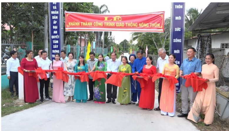
Ảnh: Lãnh đạo huyện Chợ Lách dự lễ khánh thành công trình giao thông nông thôn.