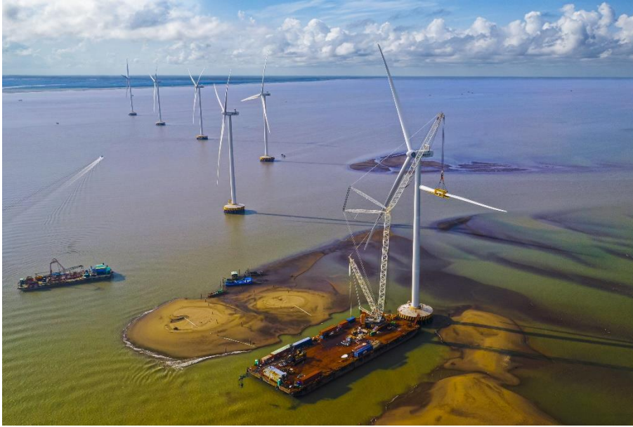
Ảnh: Xây dựng điện gió trên địa bàn tỉnh.

Tỉnh Bến Tre đã và đang là địa phương chịu ảnh hưởng nặng nề của biến đổi khí hậu, dự báo trong tương lai sẽ ngày càng gay gắt hơn. Trong thời gian qua tỉnh đã có nhiều hoạt động cụ thể để giảm tác động của biến đổi khí hậu và tăng cường khả năng chống chịu với những tác động tiêu cực do biến đổi khí hậu gây ra. Bên cạnh việc phát triển nền kinh tế theo hướng xanh hoá các ngành, lĩnh vực được đề ra từ các nhiệm kỳ trước, Đại hội Đại biểu Đảng bộ tỉnh Bến Tre nhiệm kỳ 2020-2025 đã xác định nhiệm vụ triển khai ít nhất 1.500MW điện gió được đưa vào khai thác. Sau Đại hội, các chương trình, nghị quyết cụ thể hoá đã được ban hành, trong đó có Nghị quyết số 04-NQ/TU phát triển Bến Tre về hướng Đông, giai đoạn 2021 - 2025 và tầm nhìn đến 2030 đã xác định kinh tế thuỷ sản, công nghiệp, năng lượng, du lịch biển và phát triển đô thị sẽ là những ngành kinh tế chủ lực. Chương trình 08-CTr/TU của Tỉnh uỷ về phát triển công nghiệp chủ lực, lực lượng doanh nghiệp của tỉnh giai đoạn 2021 - 2025 và tầm nhìn 2030 cũng đã cụ thể hơn, mục tiêu đưa năng lượng trở thành động lực cho sự tăng trưởng. Ngoài các loại hình năng lượng chủ lực, chương trình cũng đề ra đa dạng hoá các loại hình nguồn phát như điện sinh khối, điện rác và khí sinh học.