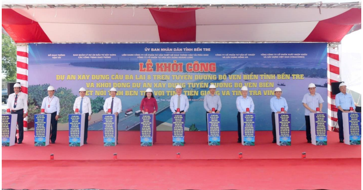
Ảnh: Lãnh đạo Trung ương và địa phương thực hiện nghi thức khởi công dự án.

Trong những năm qua, Bến Tre luôn được Chính phủ và các bộ, ngành Trung ương quan tâm, hỗ trợ, tạo điều kiện thuận lợi trong việc đầu tư xây dựng mới hạ tầng kinh tế - xã hội, đặc biệt là sự quan tâm đầu tư của Bộ Giao thông vận tải về các dự án cầu đường giao thông. Nhiều công trình quan trọng đã được đầu tư hoàn thành và đưa vào sử dụng như: Cầu Rạch Miễu, cầu Hàm Luông, cầu Cổ Chiên, các tuyến đường Quốc lộ 60, Quốc lộ 57 đi qua địa bàn tỉnh được nâng cấp, mở rộng,... Qua đó, hệ thống giao thông đường bộ tỉnh nhà từng bước được hoàn chỉnh, lưu thông hàng hóa, giao lưu kinh tế của tỉnh đến các trung tâm kinh tế của vùng được thuận lợi hơn, mở ra cơ hội mới trong liên kết, thu hút đầu tư, thúc đẩy kinh tế - xã hội phát triển nhanh và góp phần tạo ra diện mạo đô thị, nông thôn của tỉnh ngày càng khởi sắc.