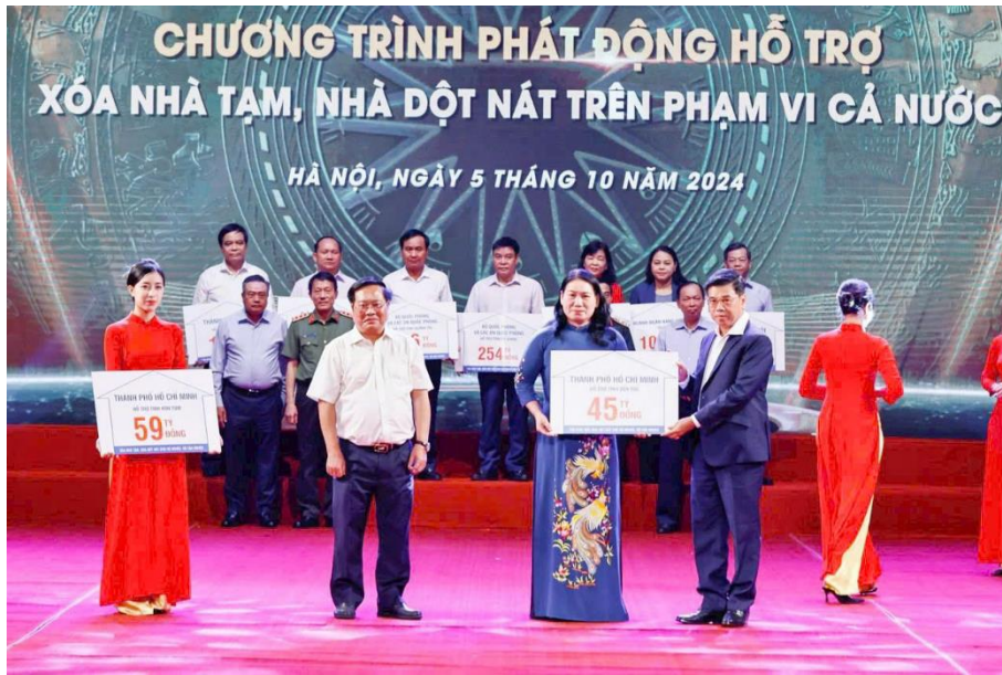
Tỉnh Bến Tre tiếp nhận kinh phí từ chương trình xóa nhà tạm, nhà đột nát năm 2024

Năm 2024, tỉnh đã tập trung vận động, huy động các nguồn lực để thực hiện công tác giảm nghèo và các chương trình an sinh xã hội trên địa bàn. Kết quả đã xây dựng 1.552/1.000 căn nhà cho hộ nghèo, cận nghèo, vượt 552 căn so với kế hoạch đề ra (trong đó đã xây dựng và bàn giao 1.112 căn, đang thực hiện 440 căn), xây mới 250 căn nhà cho các gia đình chính sách, tổng kinh phí trên 100 tỷ đồng. Bên cạnh đó, công tác huy động và triển khai các nguồn lực thực hiện an sinh xã hội được hệ thống chính trị tập trung thực hiện đạt kết quả đáng ghi nhận như: tặng 363.393 phần quà nhân dịp lễ, Tết trị giá 128,8 tỷ đồng; trao 14.900 suất học bổng, 60.429 suất học phẩm trị giá 27,5 tỷ đồng; xây dựng và đưa vào sử dụng 577 cây cầu giao thông nông thôn với 45,5 tỷ đồng, làm mới 135.927m đường giao thông nông thôn với tổng kinh phí 72,6 tỷ đồng; tổ chức khám chữa bệnh, phát thuốc miễn phí tổng kinh phí 20,3 tỷ đồng.